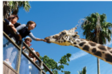
野生を感じる、自然からの 熱いメッセージに耳を傾ける、ひととき